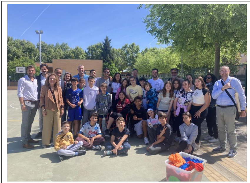
Rencontres et échanges à l'école CEIP Maestro José Fuentes