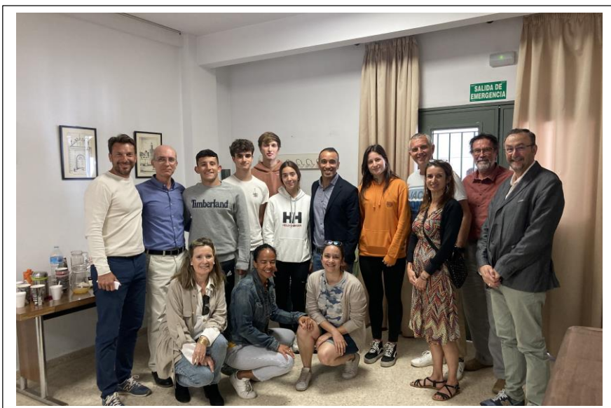
Rencontre avec les sportifs de haut niveau au IES Gustavo Adolpho Becquer à Séville