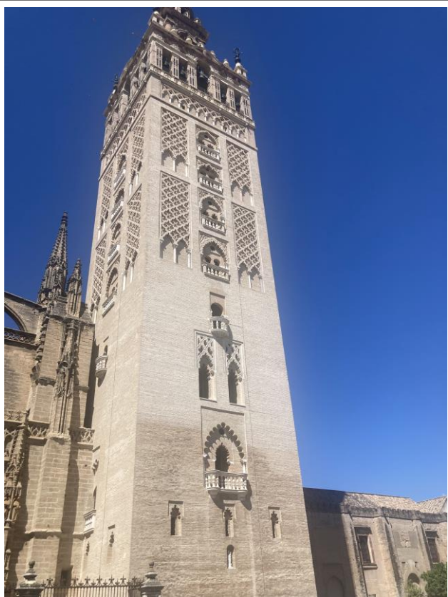
La cathédrale la Giralda, véritable emblème de la ville