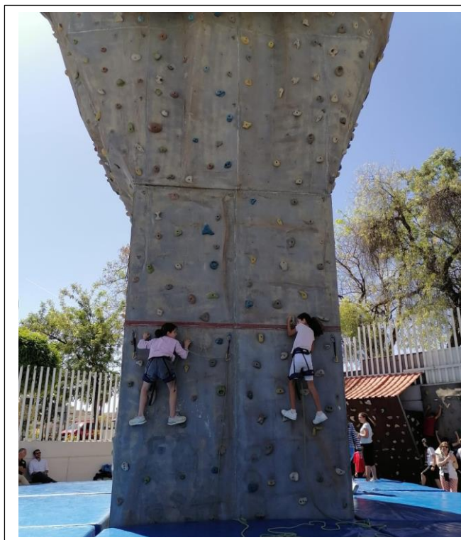
Complexe sportif de Tomares, Activité sportive encadrée par un moniteur sportif extérieur