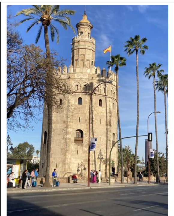
La Torre del oro