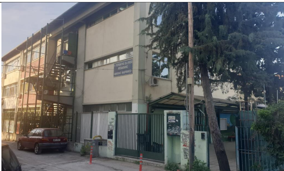
Direction Régionale de l'Enseignement Primaire et Secondaire de Macédoine Centrale.