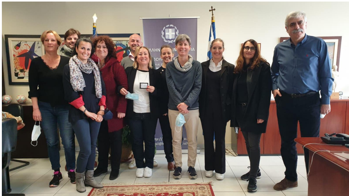
L'équipe reçue dans le bureau du Directeur Régional, Thomas BACHARAKIS.

La Régionale Directorate of Primary and Secondary Education of Central Macedonia est l'une des treize directions régionales du ministère de l'éducation Grecque. Elle constitue l'échelon direct du ministère et supervise les directions locales du primaire et du secondaire qui elles, sont en relation direct avec les établissements et se composent d'une quarantaine d'agents chacune. Cette direction régionale se compose de 80 agents répartis dans différents services :